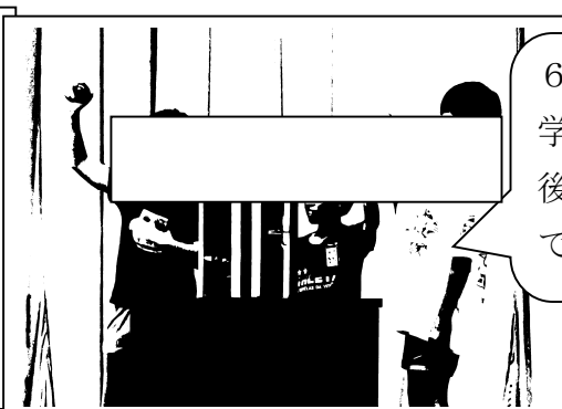
6年生は小学校生活最後の運動会ですね。