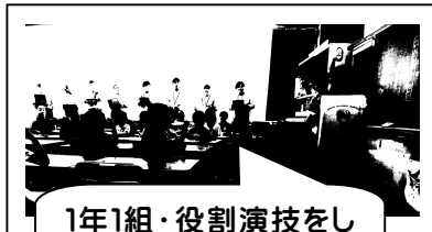
1年1組・役割演技をして、気持ちを考えます