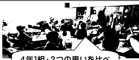
4年1組・2つの思いを比べて、より多面的に考えます。