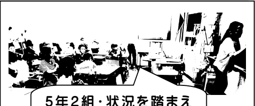
5年2組・状況を踏まえ、自己を見つめます。